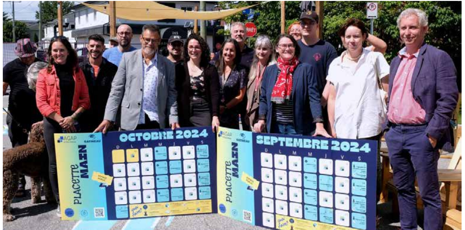
Les collaborateurs et partenaires du projet Placette Main avec les calendriers des activités pour les mois de septembre et octobre. / Collaborators and partners of the Placette Main project with the calendars of activities for the months of September and October.